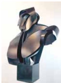
Alpha Male, patinovaná ocel