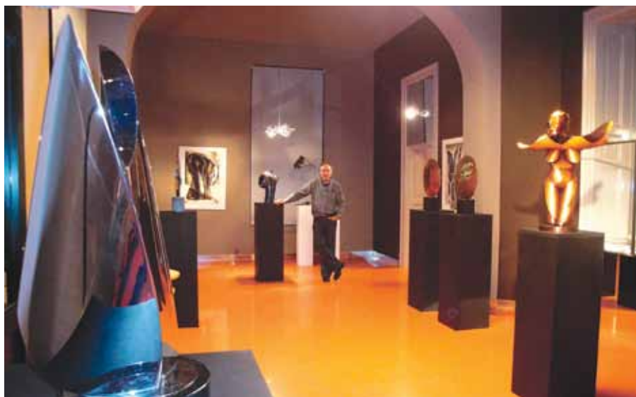
Výstava v Galerii Jedné věci Praha