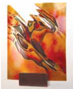
Sunburn River, bronz

Pro mě je to pořád ta správná sochařina. Jako mladý jsem dělal dekorativní prvky do architektury, což byly věci v abstraktnějších formách a byly provedeny technologií ohýbání a svařování plechu. V Americe byla tato technologie a má zkušenost velice vítaná a žádaná, minimalistický přístup k sochařské tvorbě byl na svém vrcholu. V téhle abstraktní tvorbě pokračuji doposud. V poslední době mě však znovu přitahuje figurální