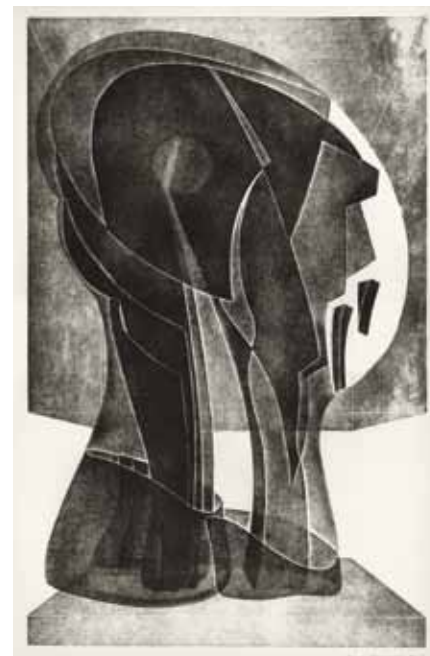
Neil Armstrong, grafika ke 40. výročí přistání prvního člověka na Měsíci

směru, měl uplatnění v podstatě zaručené. A speciálně v Ostravě, kam jsem se po Umprumce vrátil, byl pro mě začátek úspěšný. Ostrava v té době byla bohaté