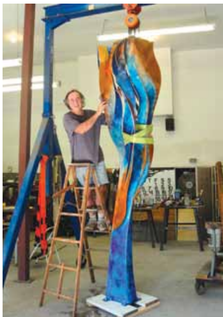
Winter Flower, patinovaná bronz, pro město Catskill

Každý americký prezident má tzv. svoji knihovnu, kde se shromáždí všech-