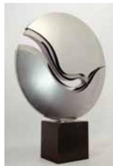
Solar Eclipse, nerezová ocel